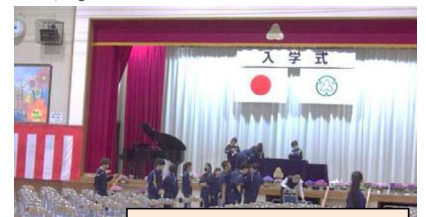
入学式準備の様子

二つ目は、 挑戦と努力 です。中学校へ入って環境も違い、大変だなと思うこともあると思います。勉強も難しくなるでしょう。しかし、簡単にあきらめないでくださいね。努力を続けられる人になってほしいです。しっかりと自ら、学んでください。皆さんは自分の未来を切り開くことができるのです。しかし、不安な時は声を出してください。大丈夫です。あなたは一人ではありません。皆さんが、一日も早く学校生活に慣れ、友達や二年生・三年生と学び合い、高め合って成長してくれることを期待しています。